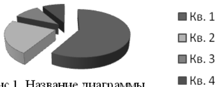
Рис 1. Название диаграммы

Выводы: Тезиса текст тезиса текст тезиса текст тезиса текст. Тезиса текст тезиса текст.